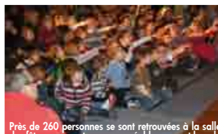
Près de 260 personnes se sont retrouvées à la salle des fêtes pour partager un agréable moment lors du spectacle de Noël proposé par Le Jardin des Lutins.

Puis, sous les yeux émerveillés des enfants, le Père Noël a fait son apparition les bras chargés de surprises. Chaque enfant a reçu un petit cadeau. Les familles se sont ensuite retrouvées au buffet pour partager le verre de l'amitié.