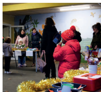
Marché de Noël à l'école Touchard