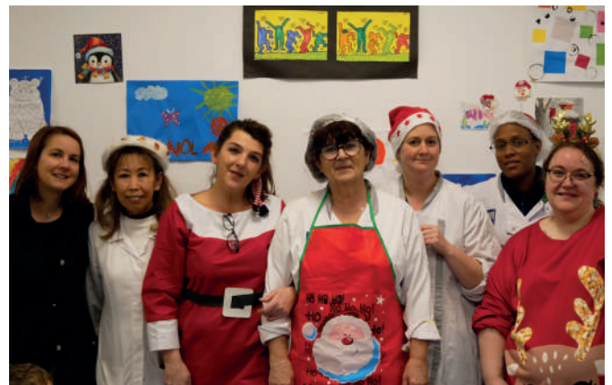
Équipe de restauration de l'école Maille et Pécoud

De l'élaboration du menu au service des assiettes, une quinzaine d'agents travaillent passionnément pour proposer des repas équilibrés et savoureux, adaptés aux goûts des enfants tout en travaillant l'éveil au goût avec pédagogie. À quelques rares exceptions près, tous les repas sont préparés et cuisinés dans nos cantines avec des produits frais en privilégiant un approvisionnement local.