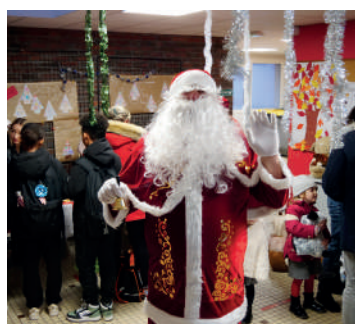
Marché de Noël à l'école Malraux