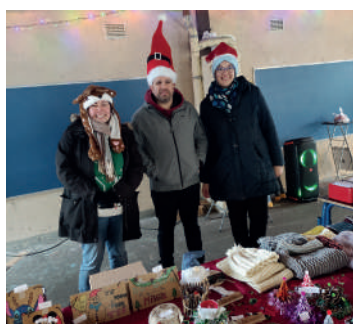
Marché d'hiver à l'école Bert-Hugo

Toutes les écoles ont participé à cette dynamique festive en proposant des activités adaptées à tous qui ont fait la joie des petits et des grands. Ce bel élan collectif a été l'occasion de renforcer les liens entre les élèves, les enseignants et les familles.