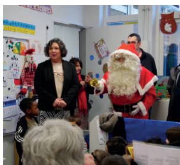
Fête de Noël à l'école Maille et Pécoud