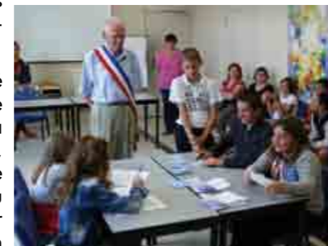
Opération de dépouillement : les scrutateurs pointent les votes.