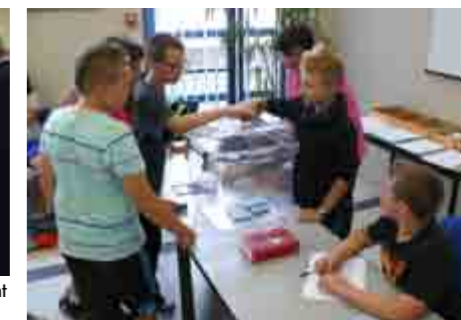
Le vote, sous l'œil attentif du président de bureau et de ses assesseurs.