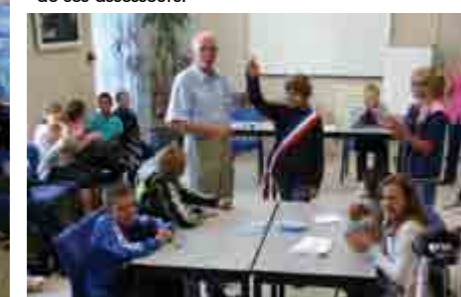
Le Maire, élu par ses colistiers.