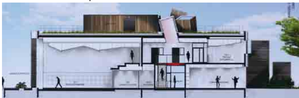
COUPE SUR LA SALLE DE MUSIQUE D'ENSEMBLE, LA FORMATION MUSICALE ET UNE SALLE DE PRATIQUE INSTRUMENTALE

Dès son ouverture, prévue à l'automne 2015, les usagers pourront profiter d'une salle de musique d'ensemble pour les différentes formations musicales, d'un pôle de formation et d'éveil musical, de salles de pratiques instrumentales diverses ainsi que de deux studios de danse.