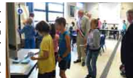
Munis de leur matériel d'élection, les jeunes se rendent à l'isoloir.

Chacune des 5 classes a été accueillie par l'équipe municipale à l'Hôtel de Ville pour participer à un atelier "Élections". Les élèves, munis de leur matériel de vote, se sont rendus aux isoloirs et ont élu leur Maire d'un jour. Un atelier éducatif qui sera ré-exploité en cours.