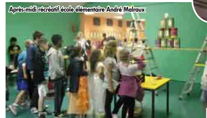
Après-midi récréatif école élémentaire André Malraux