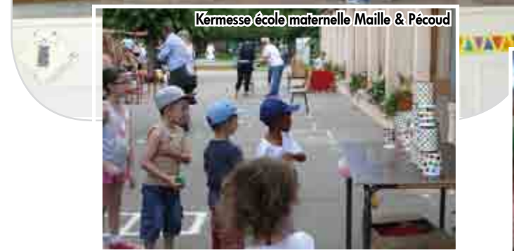
Kermesse école maternelle Maille & Pécoud