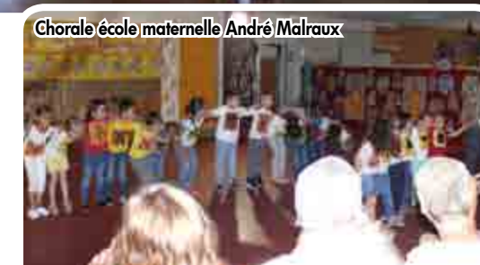
Chorale école maternelle André Malraux