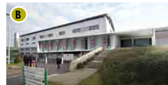
Ce chantier, d'une durée totale de 31 mois, représente un investissement de 29 millions d'euros.