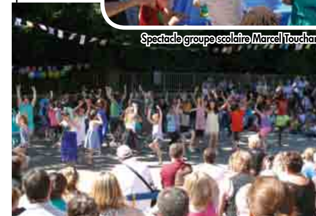
Spectacle groupe scolaire Marcel Touchard