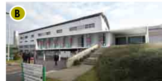
Ce chantier, d'une durée totale de 31 mois, représente un investissement de 29 millions d'euros.