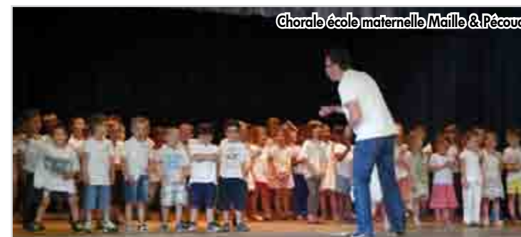
Chorale école maternelle Maille & Pécoud