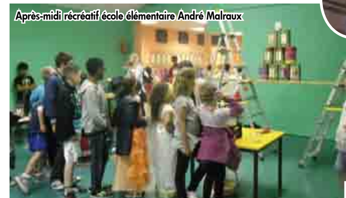
Après-midi récréatif école élémentaire André Malraux