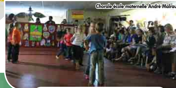
Chorale école maternelle André Malraux