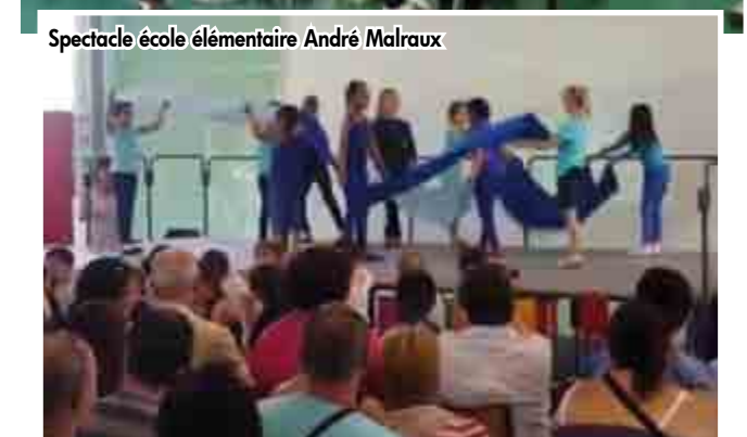
Spectacle école élémentaire André Malraux