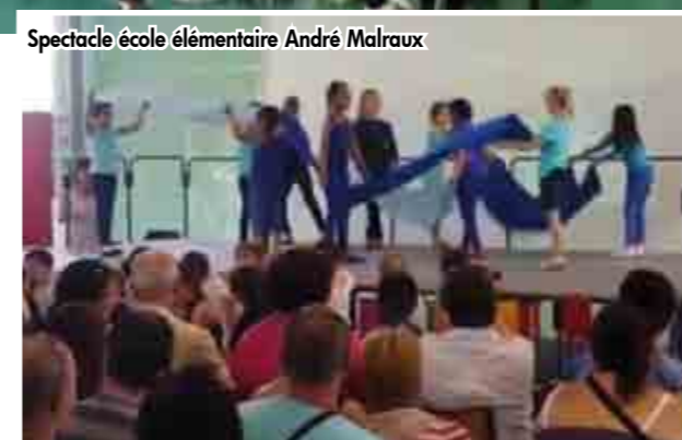
Spectacle école élémentaire André Malraux