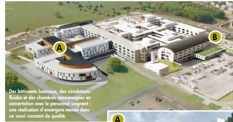
Des bâtiments lumineux, des circulations fluides et des chambres réaménagées en concertation avec le personnel soignant : une réalisation d'envergure menée dans un souci constant de qualité.

Les activités "soins de suite et réadaptation" prendront place dans un nouveau bâtiment (A) permettant d'accueillir 70 patients en