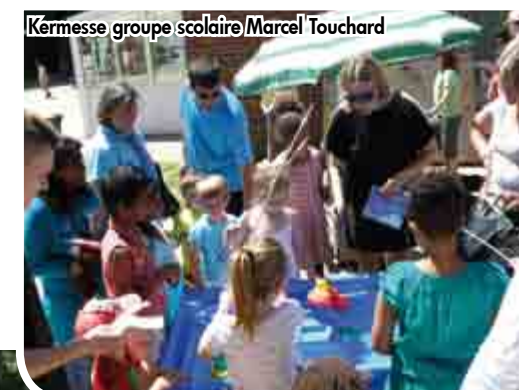
Kermesse groupe scolaire Marcel Touchard

Les élèves des écoles maternelles et élémentaires de la commune, accompagnés de leurs familles, ont participé aux chorales, remises de prix, spectacles, kermesses et autres animations proposées par les équipes enseignantes. Retour en photos sur quelques unes des animations proposées dans les écoles.