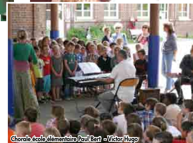
Chorale école élémentaire Paul Bert - Victor Hugo