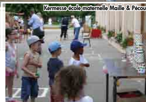
Kermesse école maternelle Maille & Pécoud