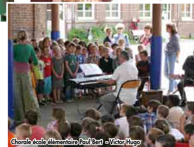
Chorale école élémentaire Paul Bert - Victor Hugo