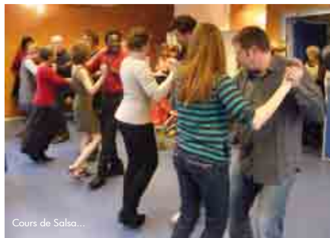
Cours de Salsa...