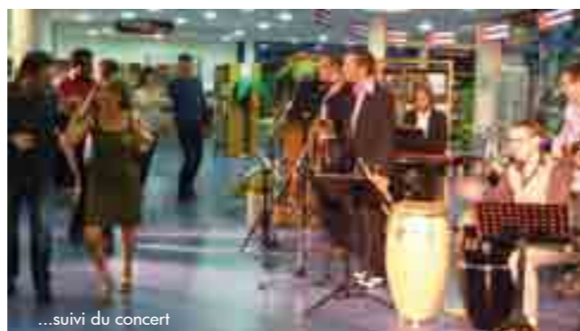
...suivi du concert

Les Saint-aubinois ont été nombreux à apprécier ce moment festif, coloré et chaleureux.