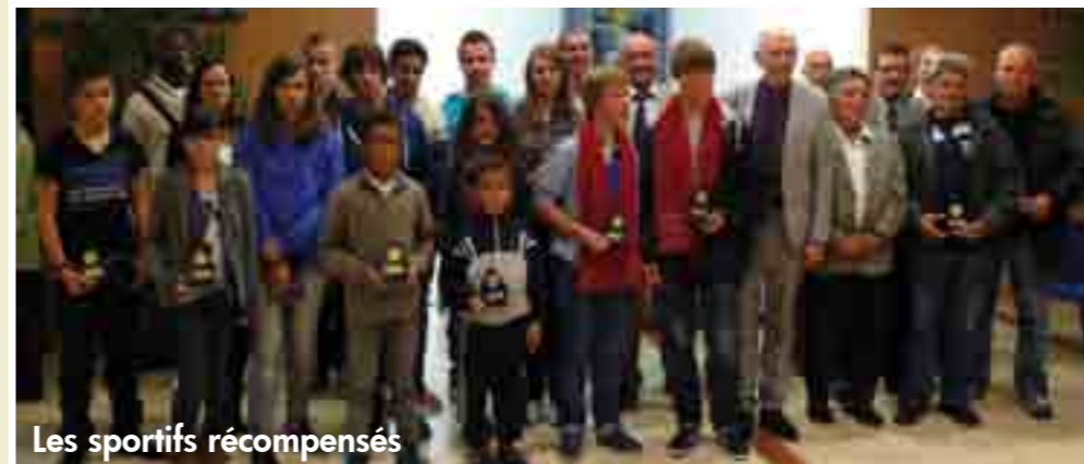
Les sportifs récompensés