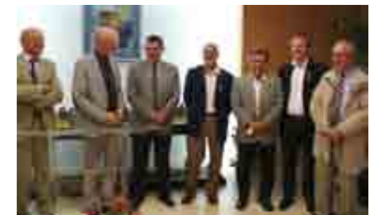
Les médaillés "Jeunesse et sports" :