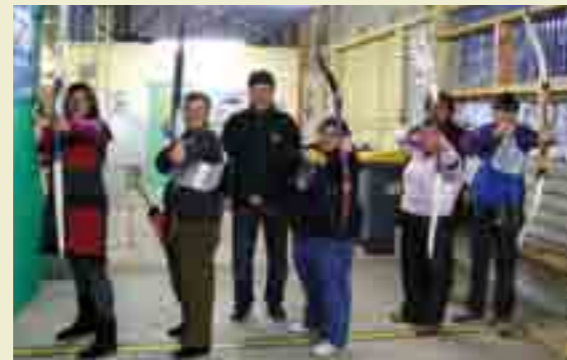
Le club compte cette année 60 membres. Les 8 archers "sport handicap" licenciés pour l'année 2012-2013 ont entre 24 et 53 ans et tirent sur des distances allant de 10 à 18 mètres. Ils pratiquent, en bonne entente, avec l'ensemble des archers.