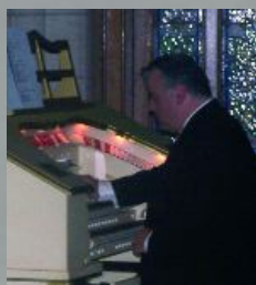
Un concert d'orgue de cinéma très apprécié