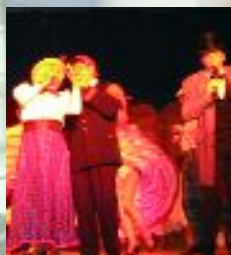
Les Aînés au rendez-vous "Music-Hall"