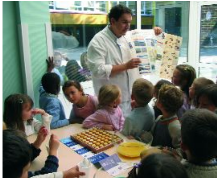
Sucré, salé, amer ou acide ? D'où vient le sel ? Comment fabrique-t-on le chocolat ? ... Les questions fusent en cette semaine du goût !