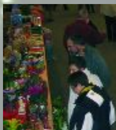
Franc succès pour la 2ème édition du Marché de Noël