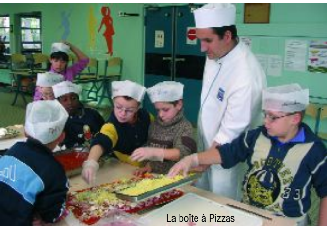
La boîte à Pizzas

Après avoir effectué un travail préparatoire autour des différents ingrédients avec leur institutrice, les enfants ont confectionné des pizzas dans les locaux de la cantine scolaire. Cette animation permettra également à la classe d'effectuer des exercices de lecture, d'écriture et de mise en scène des visuels et de travailler sur la notion de "goûter".