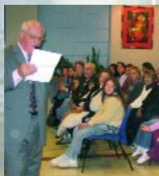
Bienvenue aux nouveaux Saint-Aubinois !