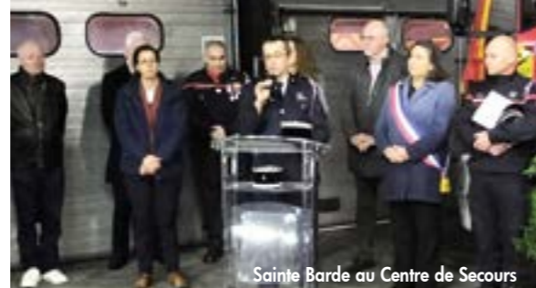
Sainte Barde au Centre de Secours