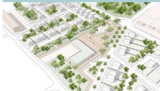
Esquisse AIA Territoires du Centre commercial des Feugrais et de ses abords – 2021

Outre l'engagement de la Région Normandie, l'Agence Nationale pour la Cohésion des Territoires (ANCT) a également confirmé en décembre 2022 son accompagnement financier au projet à hauteur de 926 000 €.