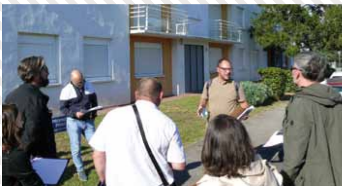
Les bailleurs sociaux** ont présenté "in situ" les projets au fil de la balade, recueillant les observations des participants.

Première étape du parcours : le site du futur éco-bourg situé à proximité de la mairie de Cléon. Les participants ont été invités à s'exprimer sur les formes architecturales qui pourraient voir le jour, l'articulation avec le bâti ancien et les zones naturelles, les aménagements à prévoir dans le cadre du "mieux vivre ensemble" ou encore, les différents dispositifs concernant la mobilité (douce et automobile).