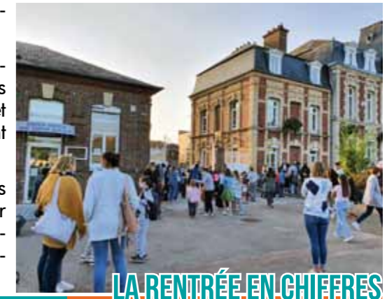
LA RENTRÉE EN CHIFFRES

Enfin, les activités périscolaires ont repris matin, midi et soir sur les différents sites avec des activités de sport, loisirs et d'accompagnement scolaire.