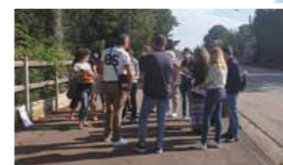
Balade urbaine et atelier participatif pour l'aménagement de la RD7.

Dans un souci de co-construction citoyenne, la Métropole, a mis en place une consultation ouverte de mars à septembre via la plate-forme "Je participe", les questionnaires, les rencontres publiques, les ateliers et les "balades urbaines" afin de recueillir l'avis des usagers et des riverains et ainsi mieux cibler les usages et les attentes sur l'aménagement de cet axe majeur.