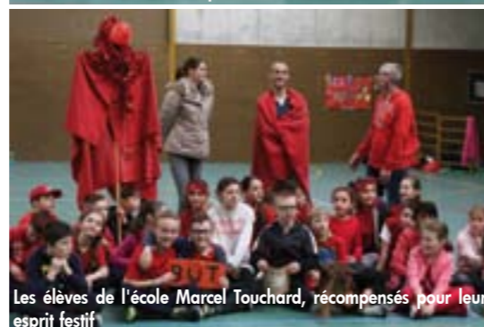
Les élèves de l'école Marcel Touchard, récompensés pour leur esprit festif