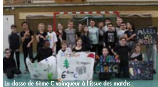
La classe de 6ème C vainqueur à l'issue des matchs