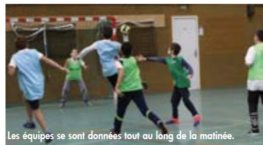
Les équipes se sont données tout au long de la matinée.