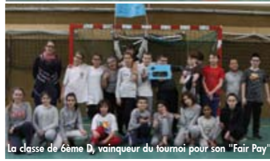
La classe de 6ème D, vainqueur du tournoi pour son "Fair Pay"