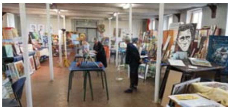
Renseignements : Atelier Les Hauts du Couvent - 123, rue de Freneuse, sur place les lundis et mardis après-midi.

Cet atelier libre est ouvert à tous. Chacun peut travailler librement la technique de son choix, il n'y a ni cours ni professeur, et peut laisser son matériel sur place. Un lieu de convivialité et d'échanges apprécié par les artistes.