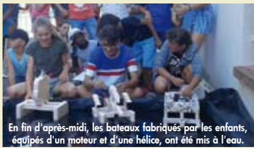
En fin d'après-midi, les bateaux fabriqués par les enfants, équipés d'un moteur et d'une hélice, ont été mis à l'eau.

Début août, une "kemesse scientifique" était organisée par la MJC et l'accueil de loisirs l'Escapade à la salle des fêtes. Près de 70 enfants, venus pour l'occasion de plusieurs centres de loisirs de l'agglomération, ont pu réaliser toutes sortes d'expériences, découvrir les rudiments de l'électricité et de la force magnétique,