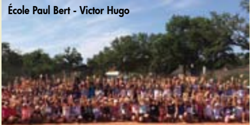
École Paul Bert - Victor Hugo

En fin d'année scolaire, les élèves des écoles élémentaires André Malraux et Paul Bert - Victor Hugo participaient aux journées découvertes "Le tennis, un sport pour tous" organisées par le Saint-Aubin Tennis Club. Une "première" très appréciée des enfants.