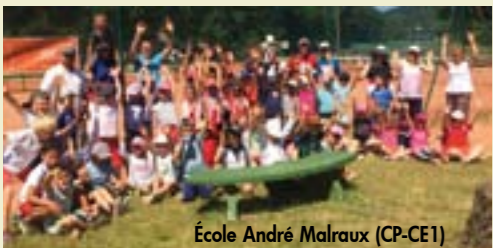
École André Malraux (CP-CE1)