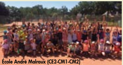
École André Malraux (CE2-CM1-CM2)