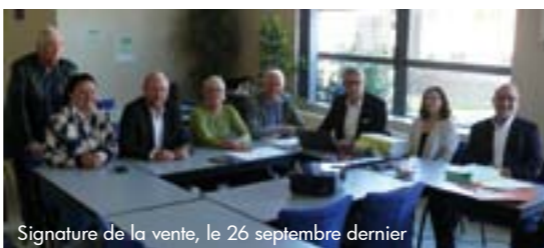
Signature de la vente, le 26 septembre dernier

La signature de la vente d'une surface de terrain de 0,8ha au groupe Aegide-Domitys avait lieu le 26 septembre. La société lancera les travaux de construction de la résidence "La Roze de Seine" en octobre pour une durée de 2 ans. Cette résidence seniors compren-