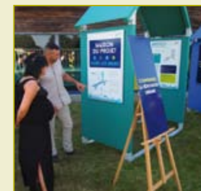
L'originalité du concept et ses couleurs vives ont attiré le public lors de la Fête d'été organisée le 27 juin dans le quartier des Novales. Les familles ont pu découvrir une quinzaine de panneaux retraçant l'historique du projet et décrivant ses différentes étapes.

Il s'agit en effet de créer un nouvel espace de vie où logements, activités, commerces et équipements se mêleront pour offrir aux habitants un environnement de qualité, propice à la vie quotidienne de ses habitants. C'est dans cette optique qu'a été créé le "Conseil citoyen", composé d'un collège d'habitants et d'un collège d'acteurs locaux.