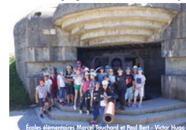
Écoles élémentaires Marcel Touchard et Paul Bert - Victor Hugo

Parmi les nombreux voyages scolaires organisés par les écoles, deux classes de CM2 des écoles Marcel Touchard et Paul Bert - Victor Hugo participaient à un voyage scolaire à destination des plages du Débarquement les 25 et 26 juin dernier.