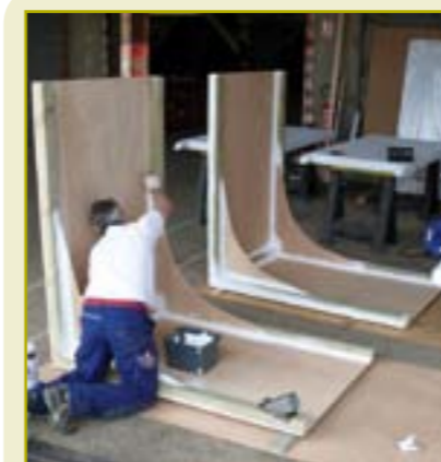
Les quatre modules constituant la Maison du projet "Hors les Murs" ont été imaginés et réalisés de manière concertée par l'équipe projet NPNRU et les agents municipaux des services techniques de Cléon et de Saint-Aubin.

Reconnu "quartier d'intérêt national" dans le cadre du Nouveau Programme National de Renouveau Urbain en 2014, ce territoire, situé sur les communes de Saint-Aubin-lès-Elbeuf et de Cléon, compte près de 2 700 habitants. Le renouvellement urbain, opération de grande envergure qui transformera radicalement le visage du quartier, ne peut s'engager qu'en concertation avec les habitants.