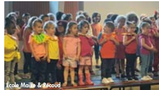
École Maille & Pécoud

Le 8 juin dernier, l'école élémentaire André Malraux proposait un spectacle et une chorale. Les familles venues nombreuses ont apprécié ce moment très convivial.