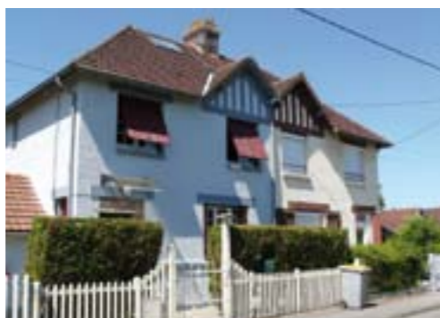
Dans ce "lotissement des 99 maisons" (au nombre réel de 98), il reste peu de maisons "pur jus d'époque". A noter qu'en 1944, la cité fut rebaptisée "cité Marcel Legrand" (du nom d'un résistant) mais ce nom ne fut pas utilisé.

le confort moderne (eau potable, électricité, évacuation des eaux usées), construites à proximité des zones d'emploi, d'équipements de proximité (écoles, commerces,...) et réservait une partie engazonnée pour le jeu des enfants.