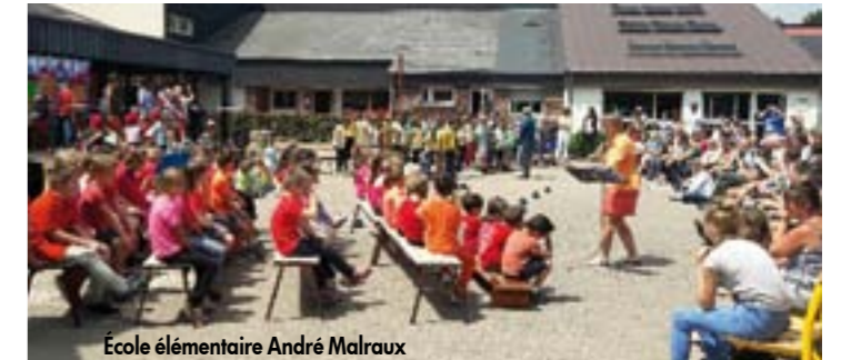
École élémentaire André Malraux

l'école. Plusieurs stands de jeux avaient été organisés par les parents d'élèves : tombola, panier garni, pêche aux canards, pop corn, ballons modelés, tirs aux pistolets à eau, poneys, calèche, chamboule tout, maquillage, ... Deux temps conviviaux qui ont ravi petits et grands !