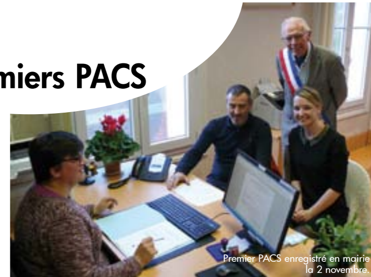
Premier PACS enregistré en mairie la 2 novembre.

Attention, pour tous les PACS conclus avant le 1 er novembre 2017, c'est la mairie de la ville où est situé le Tribunal où a été enregistré le PACS qui seule pourra effectuer les modifications ou dissolutions. En clair, un PACS enregistré au Tribunal d'Instance de Rouen ne pourra être modifié ou dissous que par la mairie de Rouen.