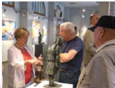
Les deux artistes étaient présents pour échanger avec les visiteurs lors du vernissage, le 6 juin dernier.