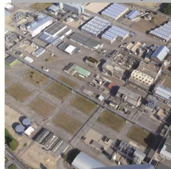
industries classées SEVESO