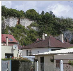
mouvements de terrain